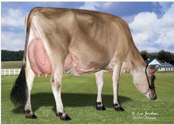
RIVER VALLEY LSTWL MACNCHEZ 5055 DAM